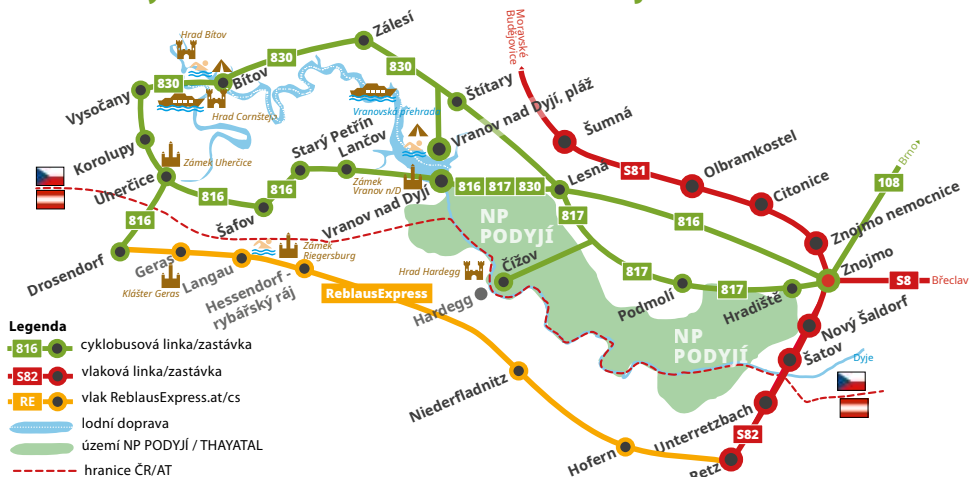
Schéma cyklobusů a vlaků IDS JMK na Znojmsku

Jízdenky IDS JMK platí také ve vlacích včetně jízdy do Retzu (linka S82), neplatí na lodní dopravě po Vranovské přehradě a v ReblausExpressu.