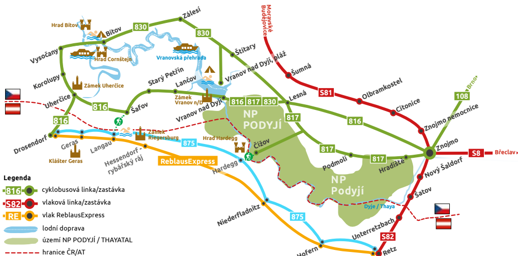
Schéma cyklobusů a vlaků IDS JMK na Znojemsku

Legenda 816 - cyklobusová linka/zastávka S82 - vlaková linka/zastávka RE - vlak ReblausExpress - lodní doprava - území NP PODYJÍ / THAYATAL - - - hranice ČR/AT